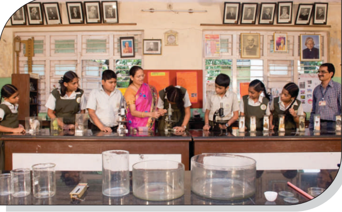
सुसज्ज प्रयोगशाळेत विद्यार्थी सूक्ष्मदर्शक वापरताना